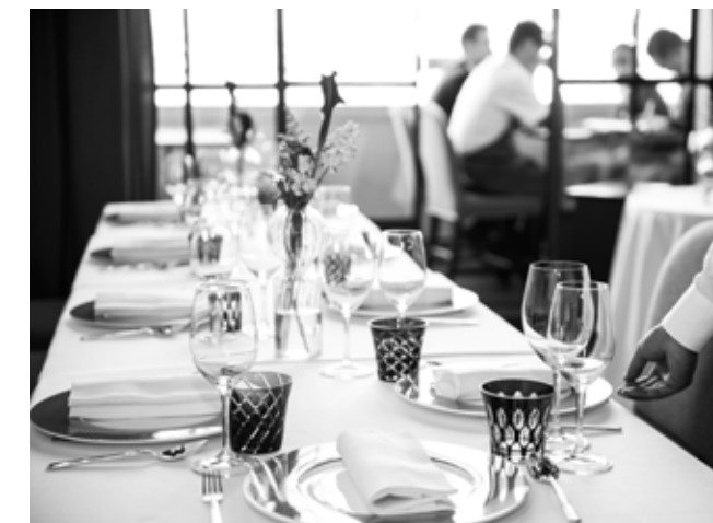
In alto: Striche Arancio al Grand Hotel Tremezzo, Lago di Como In basso: Bicchieri Twins al Grand Hotel Lungarno, Firenze A sinistra: Carteda Zogo, Bistrò al Grand Hotel Tremezzo, Lago di Como